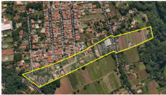
Imagem 1 – Imagem de Satélite do Loteamento Residencial Alto das Vinhas