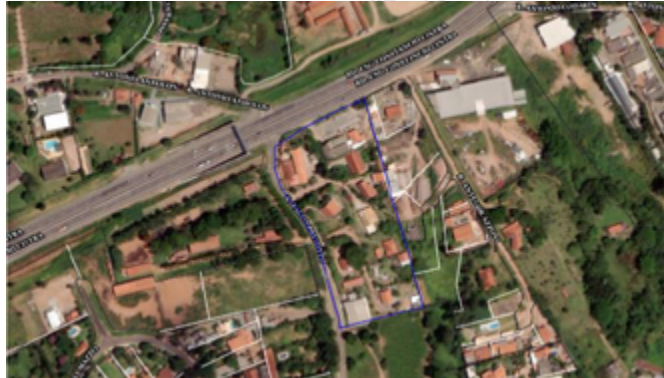
Imagem 1 – Imagem de Satélite do Loteamento Azzoni